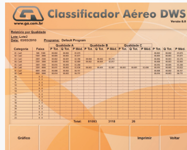
Relatório por qualidade