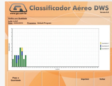
Gráfico por qualidade