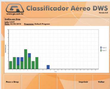
Gráfico por drop