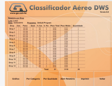
Relatório por drop